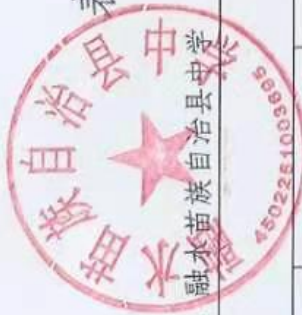
表七：一般公共预算财政拨款“三公”经费支出决算表